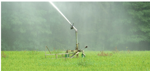
Bewässerung (hier im Reisanbau im Tessin, Schweiz) schützt Pflanzen vor Trockenheit, solange genügend Wasser verfügbar ist.

Mit einer Reihe von Anpassungsmaßnahmen versucht man, solche Dürrefolgen zu begrenzen: Etwa mithilfe von Stauseen und Kanälen, der Förderung von Grundwasser und durch Bewässerung landwirtschaftlicher Kulturen. Die Kapazität dieser Infrastruktur ist aber begrenzt und schützt die betroffenen Sektoren und Akteure nur teilweise.