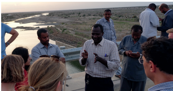
Enger Austausch aller Projektbeteiligten vor Ort

Im Projekt erfolgt eine enge Einbindung der lokalen Partner aus Äthiopien und dem Sudan. Regelmäßige Workshops und Trainingskurse online und in der Zielregion sowie der Austausch von Doktoranden zielen darauf ab, das SPS System in einem als Co-Developent bezeichneten Prozess gemeinsam zu entwickeln. Die Forschenden teilen ihre Methoden und Informationen und führen gemeinsame Forschungsaktivitäten durch. Die enge Anbindung auch in die Politik und Wasserwirtschaft durch Beteiligte in beiden Ländern erlaubt den weiteren Transfer der Arbeiten in die Praxis und damit einen nachhaltigen Einsatz der entwickelten Methoden auch über die Projektlaufzeit hinaus.