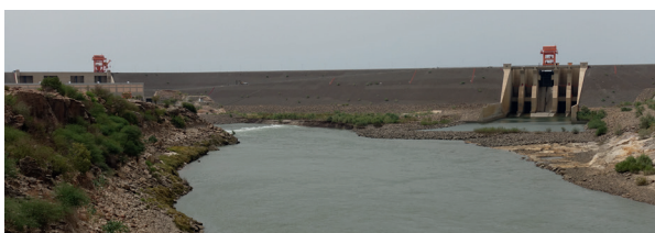
Wassermanagement im Sudan: der Upper-Atbara Staudamm

Um frühzeitig Maßnahmen gegen eine Vielfalt von Extremereignissen einleiten zu können, müssen deshalb mehrmonatige, saisonale Vorhersagen mit solchen kombiniert werden, die kürzere Zeiträume von zwei bis zu sechs Wochen im Voraus abdecken. Im Verbundprojekt